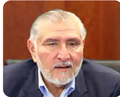
Adán Augusto López