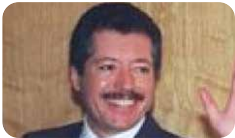
Luis Donaldo Colosio Murrieta