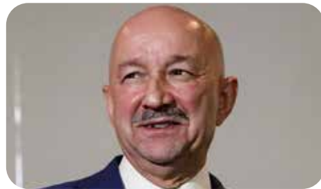
Carlos Salinas de Gortari