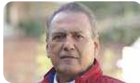
Manlio Fabio Beltrones Rivera