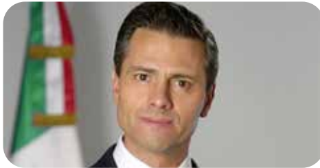
Enrique Peña Nieto